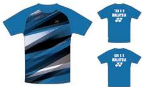
ファインブルー(タン/クー ペア)