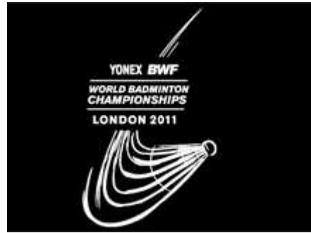
右袖デザイン拡大図