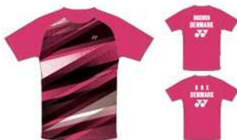
ルージュピンク(モゲンセン/ボー ペア)