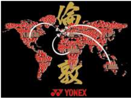
背面デザイン拡大図