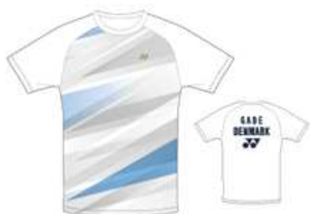
ホワイト(ピーター・ゲード)